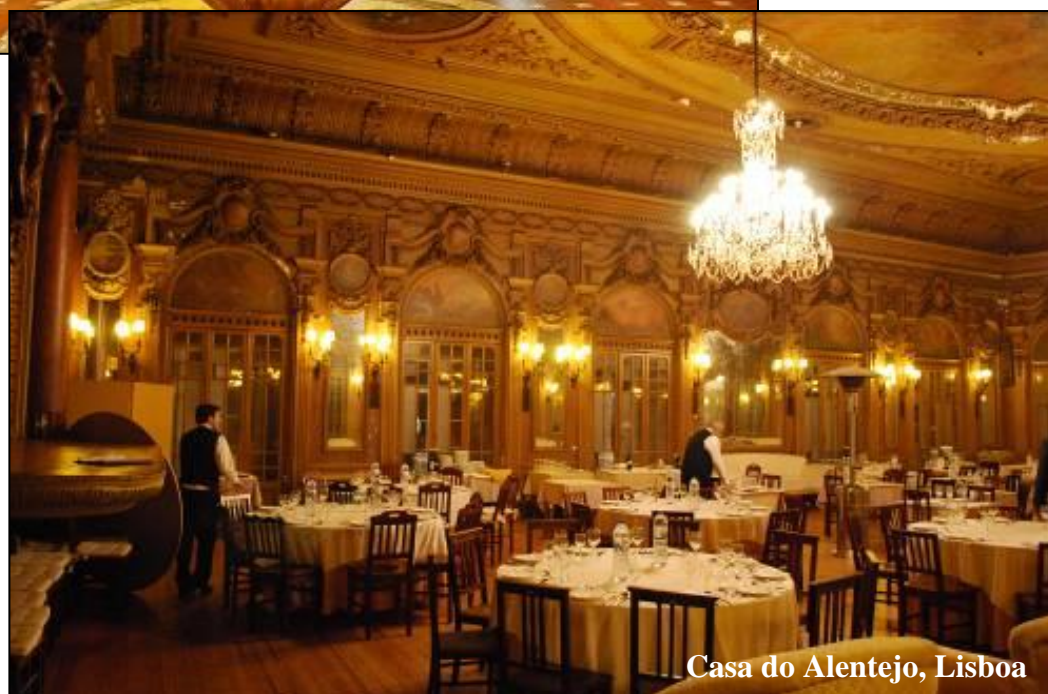
Casa do Alentejo, Lisboa